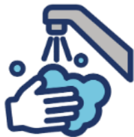
Lavate las manos con jabón