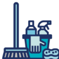
Limpiá con frecuencia